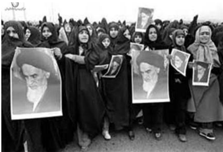
راهپیمایی بانوان بوشهری در دوران انقلاب اسلامی ۱۳۵۷

نشانه‌های شکوفایی انقلاب اسلامی با محوریت «قیام خونین ۱۹ دی ماه قم» در استان بوشهر..... ۴۴۱