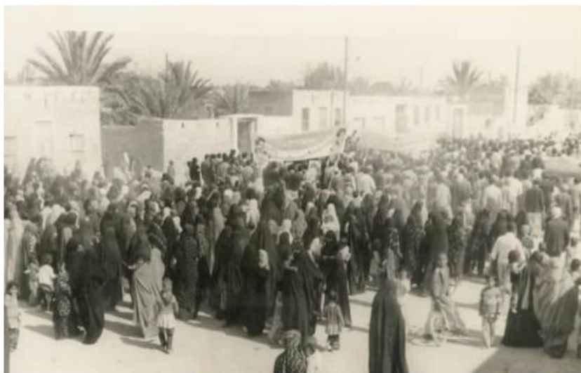
راهپیمایی بانوان بندر دیر استان بوشهر در دوران انقلاب اسلامی ۱۳۵۷