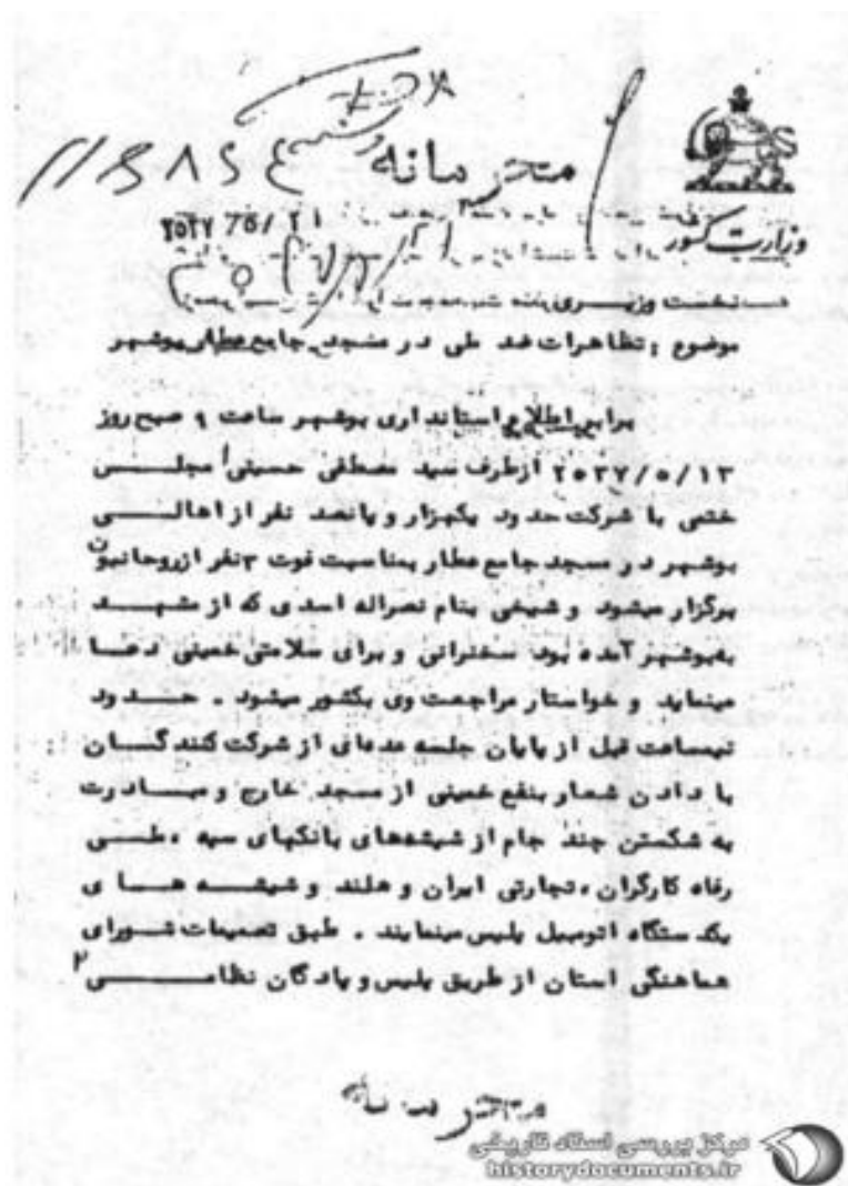
انقلاب اسلامی به روایت اسناد ساواک - کتاب ۸، راهپیمایی بزرگ بوشهر مورخ ۱۳/۵/۱۳۵۷ یا تشکیل مجلس ترجمیم حاج شیخ احمد کافی