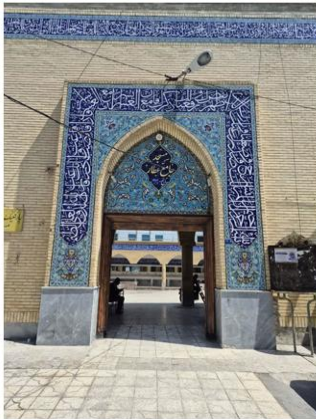
درب ورودی باز سازی شده مسجد جامع عطار بندر بوشهر، مرکز اصلی فعالیت انقلابی مردم استان

در دوران انقلاب اسلامی ۱۴۰۴