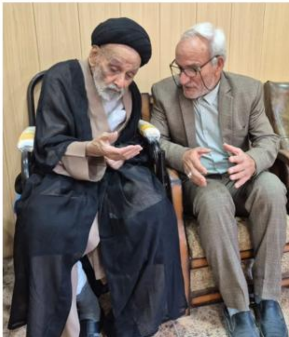
گفتگوی نگارنده مقاله (ماشاالله عالیحسینی) با آیت الله سید مصطفی حسینی از رهبران روحانیت مبارز استان بوشهر در قبل از پیروزی انقلاب اسلامی