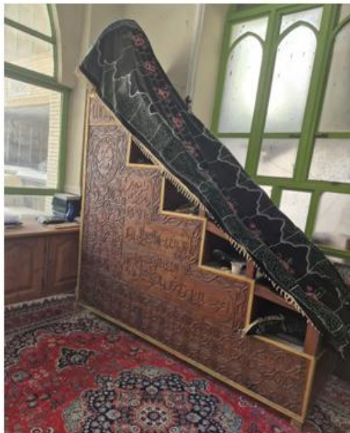
منبر مسجد جامع عطار بوشهر که از سال ۱۳۵۵ تا پیروزی انقلاب فریادهای حجت الاسلام شهید شیخ ابوتراب عاشوری

و علمای مبارز علیه طاغوت از آن بر می‌خاستند عکس از نگارنده