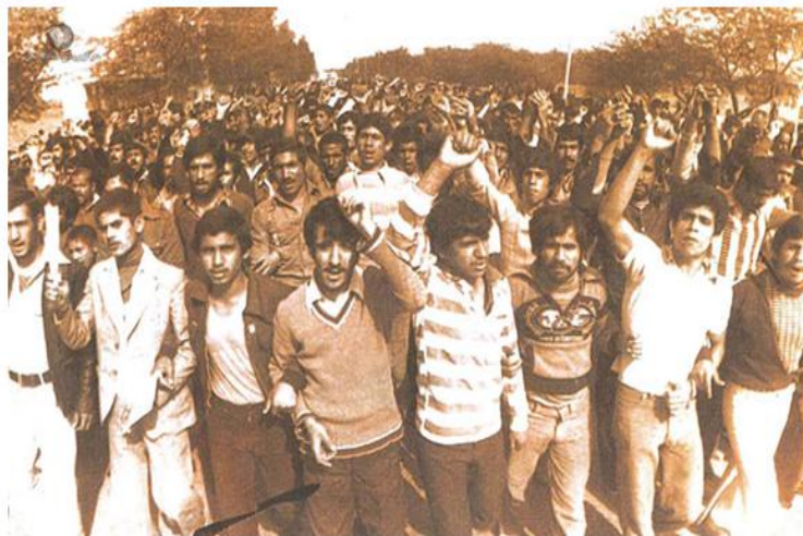
راهپیمائی بزرگ مردم بوشهر در خیابان امام خمینی (سنگی سابق)، ۱۳۵۷