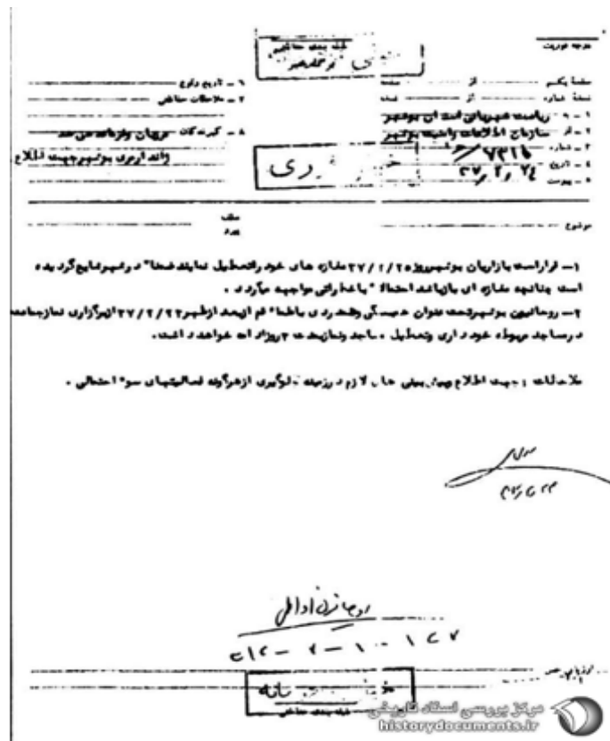
کتاب شهید حجت الاسلام شیخ ابوتراب عاشوری صفحه ۹۹۱ تعطیلی ۳ روز مساجد و نماز جماعت به جهت همبستگی با علمای قم ۵ب