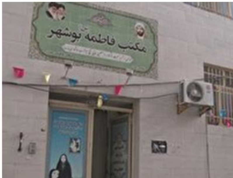
مکتب فاطمیه بوشهر، مرکز برنامه ریزی فعالیت های انقلابی بانوان بوشهر پس از قیام ۱۹ دی ۱۳۵۶ قم.