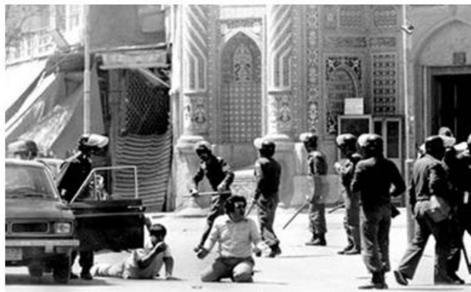
صحنه سرکوب تظاهرات ۱۹ دی ۱۳۵۶ شهر قم