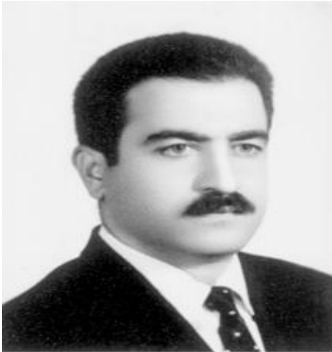
سند شماره ۴: عبدالرحیم چنگیز

۴۰۲ ..... دوفصلنامه تحقیقات اسنادی انقلاب اسلامی، سال هفتم، شماره ۱۴، پاییز و زمستان ۱۴۰۴