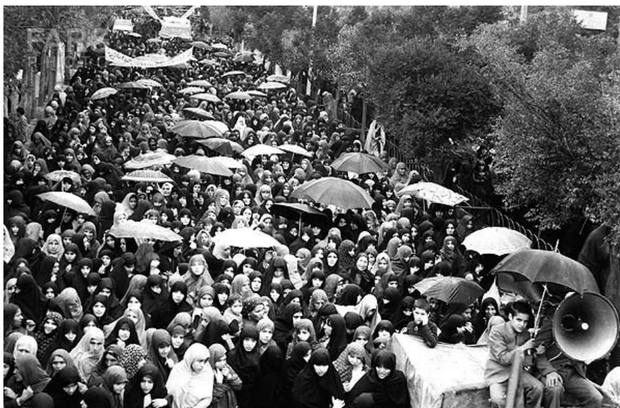
تصویر ۳. حضور پرشکوه زنان شهر اراک در تظاهرات ضد رژیم پهلوی

ویژگی همگانی بخشید. علاوه بر این، زنان از طریق ادبیات سیاسی و نقادی، حضور گسترده‌ای در صحنه‌ی روشنگری انقلاب داشتند. همچنین بخش مهمی از اعضای جنبش‌های چریکی و مسلحانه را زنان تشکیل می‌دادند. به‌رغم تبلیغات رسانه‌های رژیم پهلوی مشارکت توده‌ی زنان ایران در انقلاب اسلامی ایدئولوژی نظام حاکم در غربی‌سازی را که بیش از همه به‌واسطه زنان به اجرا درمی‌آمد، به چالش کشیده و نشان داد زنان ایران همچنان به عقاید خود پایبند هستند. مشارکت زنان بیش از همه از طریق شبکه‌های مساجد، انجمن‌های مذهبی و اسلامی، اماکن زیارتی و به‌خصوص از طریق جلسات خاص زنانه نظیر «روضه»، «سفره»، «هفته‌خوانی» و مکتب‌های زنانه نظیر «مکتب حضرت زینب (س)» و «مکتب نرجس» و... انجام می‌گرفت. این جلسات همانند یک سازمان در بسیج سیاسی زنان نقش داشت و زنان با شرکت در این جلسات که به‌ظاهر فقط مذهبی بود، از اوضاع اجتماعی - سیاسی و حوادث مهم انقلاب مطلع می‌شدند و یکی از مهم‌ترین بخش‌های جامعه مدنی را تشکیل می‌دادند. در واقع می‌توان گفت: گرچه تنها سازمان رسمی زنان به دولت وابسته بود اما بخش عظیمی از زنان در قالب‌های دیگری خصوصاً نهادهای مذهبی تشکل یافته و در بسیج سیاسی برای انقلاب اسلامی شرکت نمودند (زورام، ۱۳۷۶: ۳۰۱).