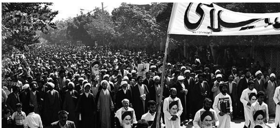
تصویر ۱. حضور روحانیون در صف اول تظاهرات علیه رژیم پهلوی در شهر اراک