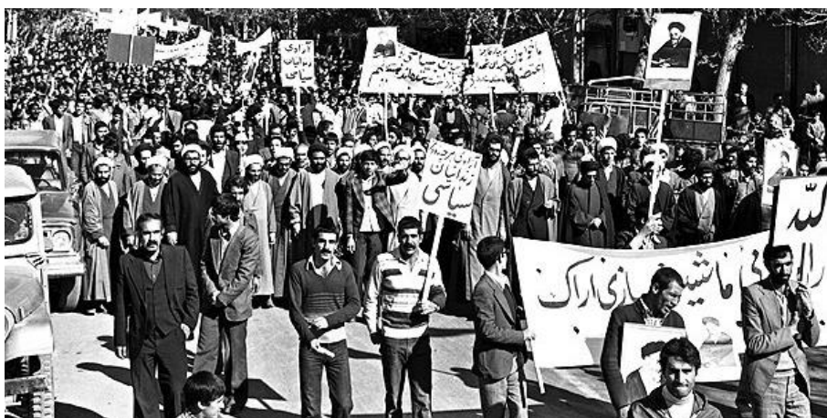
تصویر ۲. حضور کارگران ماشین‌سازی در تظاهرات علیه رژیم پهلوی