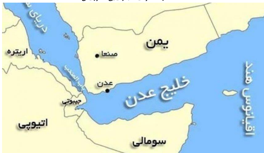
نقشه شماره ۱. موقعیت جغرافیایی کشور یمن