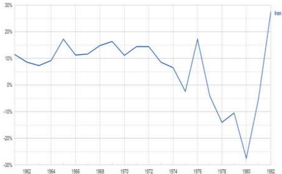
نمودار شماره ۵. درصد رشد تولید ناخالص داخلی ایران (۱۹۶۰-۱۹۸۲)

Source: https://www.google.com/publicdata/explore , (2019)