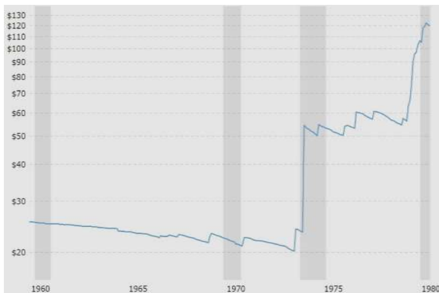
نمودار شماره ۲: قیمت جهانی نفت (۱۹۶۰-۱۹۸۰) بر پایه ارزش برنت ۲۰۰۵

Source: https://www.tradingeconomics.com/iran/crude-oil-production , (2019)