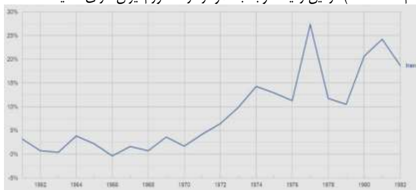
نمودار شماره ۴. درصد تورم در ایران (۱۹۶۰-۱۹۸۲)