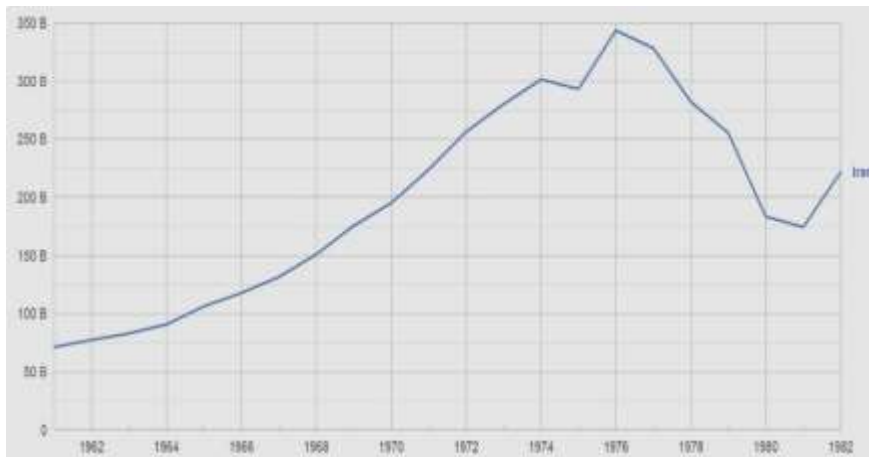
نمودار شماره ۳. تولید ناخالص داخلی ایران بر اساس دلار ثابت سال ۲۰۰۰ (۱۹۶۰-۱۹۸۲) میلیارد دلار

Source: https://www.google.com/publicdata/explore , (2019)